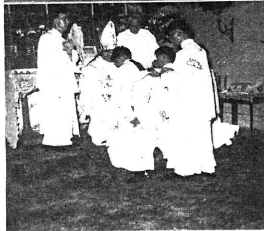
晉鐸禮中莊重的按手禮。(下)晉鐸禮最後部份,主教把新鐸的祭衣自肩頭放下。