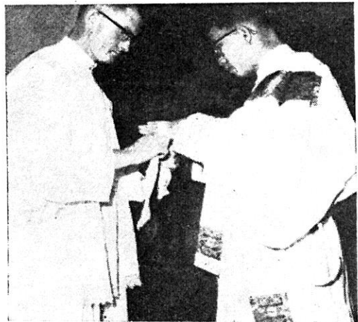
晉鐸和領五品的修士,伏地唱聖人列品禱文。晉鐸者手上塗了聖油,這是一雙祝聖過的手了。