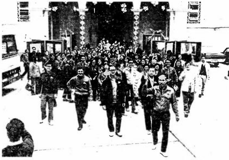
領率自親教主李，行萬百金益公港香持支起發友教堂總道堅日主上 。情形發出始開前場廣堂總在為圖，加參