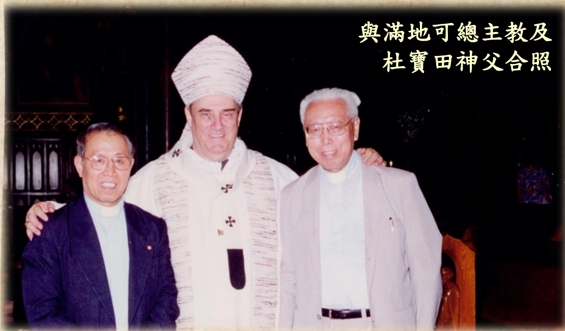
與滿地可總主教及 杜寶田神父合照