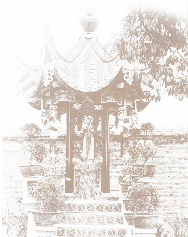
第一座聖母亭，1945年（福州泛船浦主教座堂）