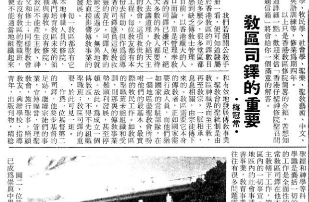
圖二、位於九龍西貢的聖神修院，今日已成為崇真中學的校舍。