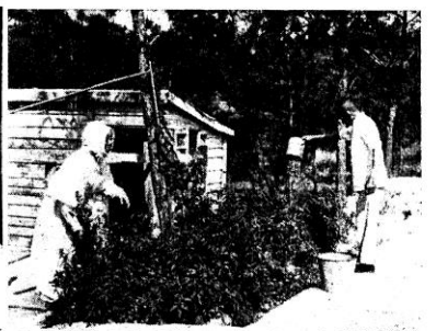
◊ 草花植種女修助協們他時間 ◊