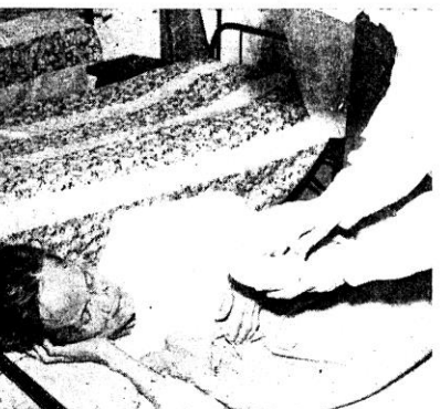
◊ 藥遞茶端們他給女修，人老的病有 ◊