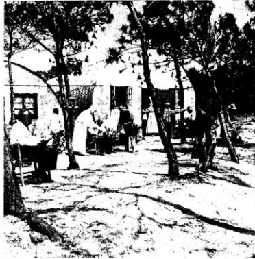
◊ 舍宿人老的搭架時臨仔港香 ◊