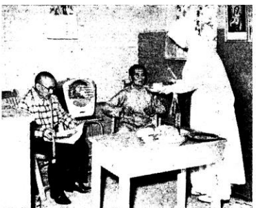
◊ 勤殷別特侍服女修，人老的廢殘對 ◊