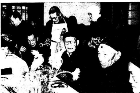
◊ 待招任自親必教主白，人老宴歡禮懣若聖年每 ◊