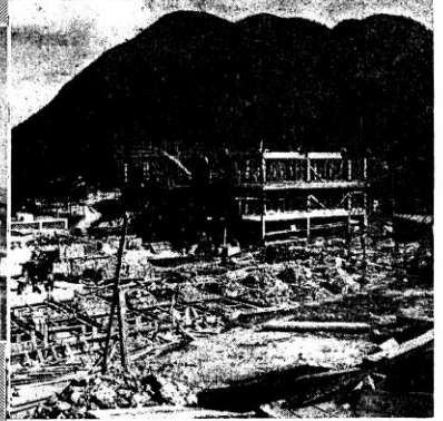
◊ 院老安新的中恭建仔港香在 ◊