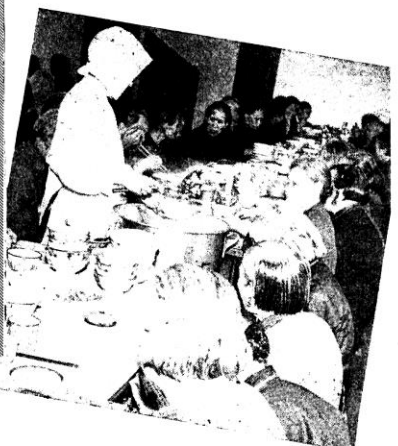
◊ 應侍充女修，餐就人老 ◊

安老院巡禮 主辦男女安老院，當時她們從嘉諾撒修會手中，接收照料六十個老人之責任。今日收容人數達四百二十名，男女各半，院內已無空額。 牛池灣院址建於一九三三年，一九五三年及五五年增建宿舍二座，由香港賽馬會及「該院之友」所捐贈。宿舍外並有男女殘廢病院各一。身體健全之老人，每日協助料理院內事務，這樣做對他們身心都有裨益，使他們感覺本身仍為社會上有用之份子。 最近安老會修女在香港仔黃竹坑興建新院，建築經費由香港賽馬會捐助一百萬元，政府當局撥出土地。男女宿舍全部工程可望於本年開竣工，可容納四百名無所依恃的老人。 過去一年內，該會已派出四位修女先行到香港仔新院址建立臨時宿舍，收容十名男性老人。