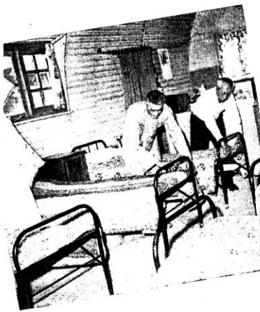
◊ 潔整持保遠永舍宿使，舖床理整己自們他 ◊

安老院巡禮 主辦男女安老院，當時她們從嘉諾撒修會手中，接收照料六十個老人之責任。今日收容人數達四百二十名，男女各半，院內已無空額。 牛池灣院址建於一九三三年，一九五三年及五五年增建宿舍二座，由香港賽馬會及「該院之友」所捐贈。宿舍外並有男女殘廢病院各一。身體健全之老人，每日協助料理院內事務，這樣做對他們身心都有裨益，使他們感覺本身仍為社會上有用之份子。 最近安老會修女在香港仔黃竹坑興建新院，建築經費由香港賽馬會捐助一百萬元，政府當局撥出土地。男女宿舍全部工程可望於本年開竣工，可容納四百名無所依恃的老人。 過去一年內，該會已派出四位修女先行到香港仔新院址建立臨時宿舍，收容十名男性老人。