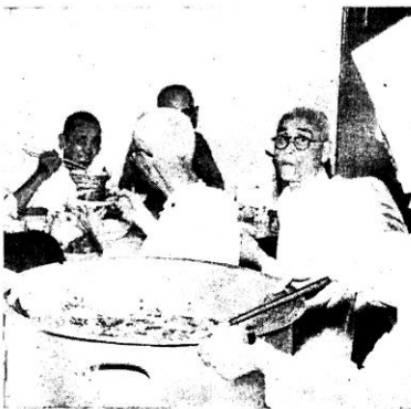
◊ 照料們他給自親女修是都，食膳的們人老 ◊