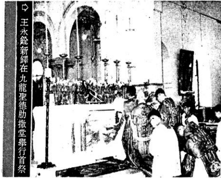
王水鏡新鐸在九龍聖德肋撒堂舉行首祭