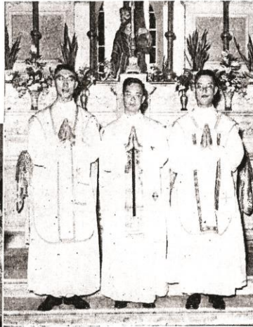
登永王（起右）輝新位三區教本 。父神宜約鄰，父神祥德黃，父神