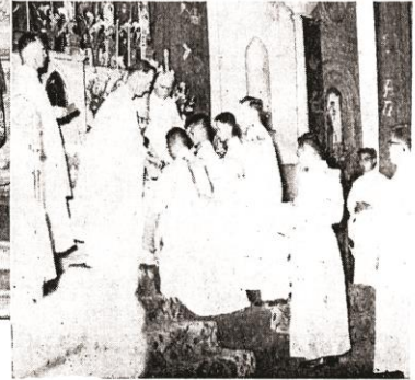
晉輝禮中主教披祭服給新輝，同時念： 請你領受司祭的祭披，這是愛德的象徵：