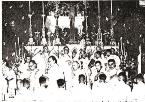
禮子復行輝新向，後教主維長神的禮參中式儀輝晉在