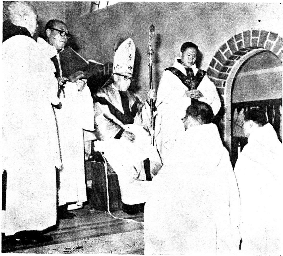
◦ 品領及願永發持主士修二會薦熙為教主白