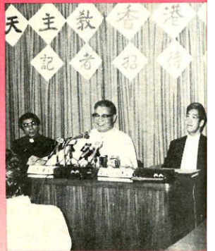
胡主教在記者招待會上