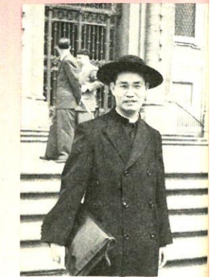
在羅馬攻讀聖教法律