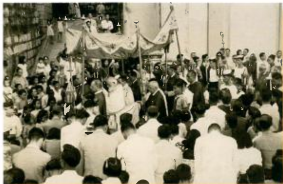
在總堂舉行聖體遊行

1946年是戰爭結束後一年。該年，中國建立了聖統制，各地建立自己的教區，連香港也成為這聖統制的一部份。1947年籌備了大遊行由總堂出發到動植物公園（以前稱兵頭花園），現