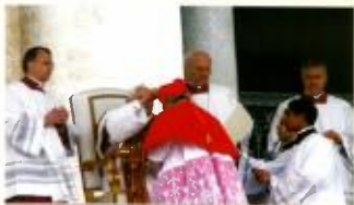
Conferring The Berretta